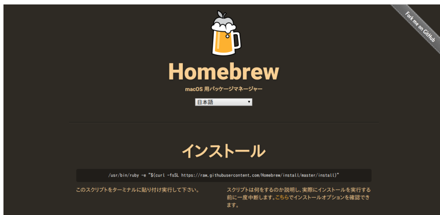
図 C.2 Homebrew の Web サイト

ターミナルで brew -v コマンドを実行し、次のような結果（バージョン番号や日付は異なるかもしれません）が表示されれば Homebrew のインストールが完了しています。